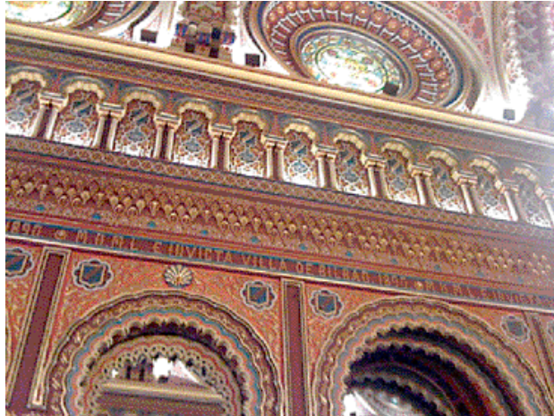
El Salón Árabe del Consistorio bilbaíno es un claro ejemplo del estilo neo-mudéjar

tuado frente a los populares Jardines de Albia, inaugurado el 7 de julio de 1903 por el gran promotor navarro Severo Unzué Donamaria destaca, entre varias originalidades, la calidad de sus azulejos y la no menos singular decoración de inspiración mudéjar, con techos policromados y una abundante colección de pinturas murales.